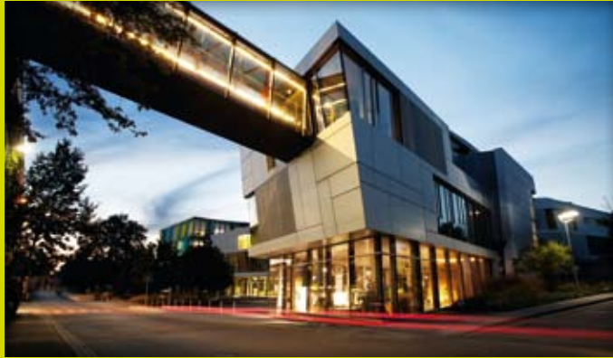
Zentrale Firmengebäude in Bad Rodach

Die Wehrfritz GmbH ist ein Unternehmensbereich der HABA-Firmenfamilie. Alle Unternehmen stehen für Qualität, Innovation und ausgezeichnete Arbeit.